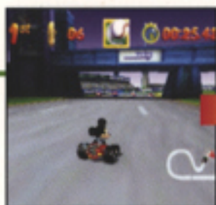
▲いらぬウェポンを持っていたら……

すでにウェポンを持っている場合は、タルを通過してもウェポンは手に入りません。いらぬウェポンは、すぐに使ってなくしてしまいましょう。