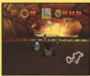
▲前方のレースカーをねらって撃ったところ。

後方に置くなら、せまい道の上に放つと避けにくく効果的です。前方に撃てば、先を行くレースカーを攻撃できます。