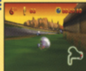
▲うまく使えばショートカットも可能。

シールド シェルの使用中は、スピードの落ちる砂地などの影響も受けません。場所を選んで使えば、近道をすることも可能です。