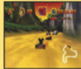
▲ストレートで使う。

壁などにぶつかる壊れてしまいます。コース内のストレートで前方のレースカーをねらいましょう。