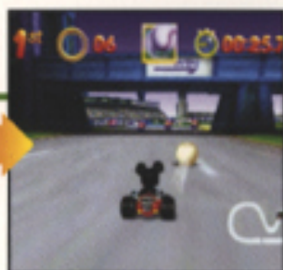
▲早めに使ってしまいましょう。